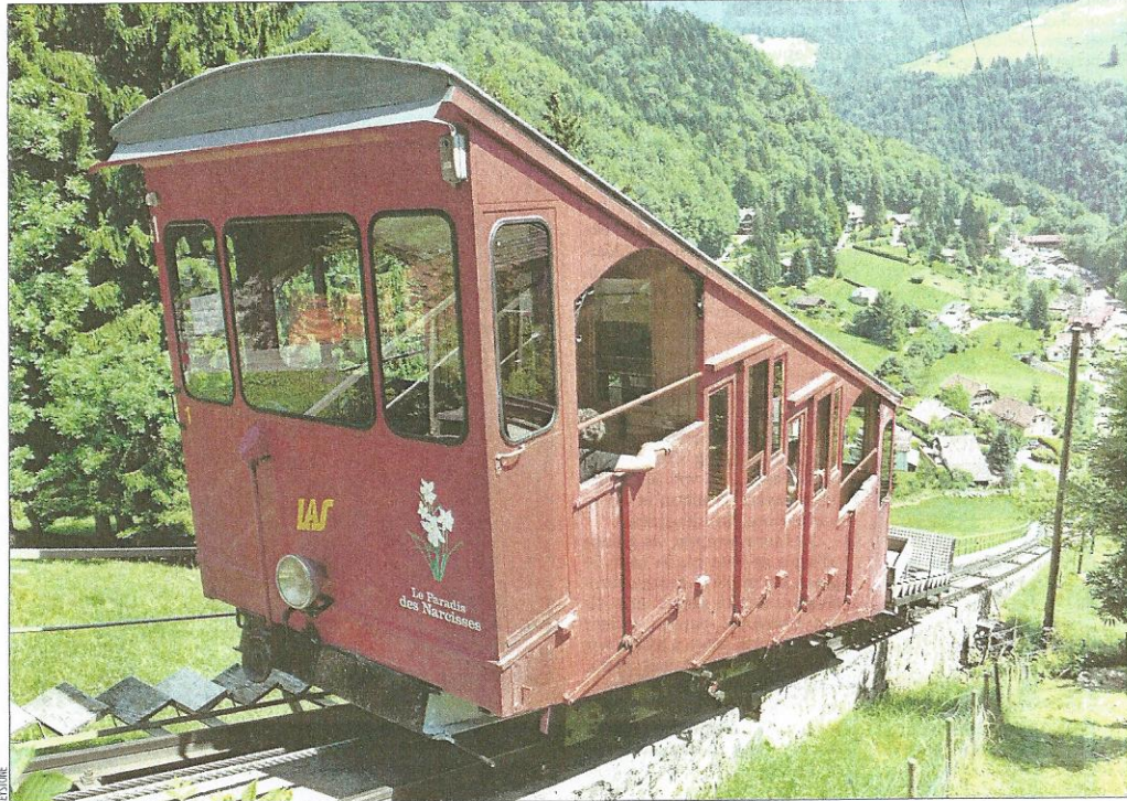
EN SERVICE Ce week-end, le LAS a été utilisé par les skateurs du Bukolik. Le funiculaire, automatisé depuis 1950, est un bidirectionnel. Il a été construit en un temps record: cinq mois. Le trajet dure 6 minutes. LES AVANTS, LE 8 AOÛT 2010

Chaudet. Selon l'avocat lausannois, le permis de construire n'a pas encore été délivré. «Des incertitudes planaient quant à la transformation du funiculaire, notamment l'accès d'arrivée en direction de l'hôtel, mais la solution est en passe d'être trouvée.» Le projet est devisé à 22 millions. La structure emploiera de 40 à 60 personnes.